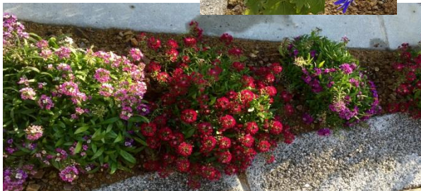
色とりどりの花壇の花