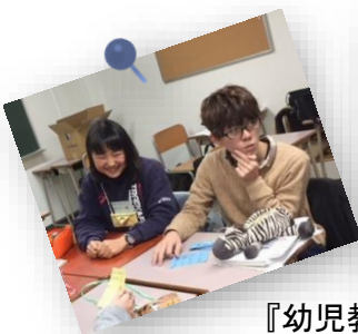
『幼児教育指導計画論』

本格的な実習は保育実習が初めてということもあり、受講生は真剣な眼差しで講義を受け、課題に取り組んでいました。