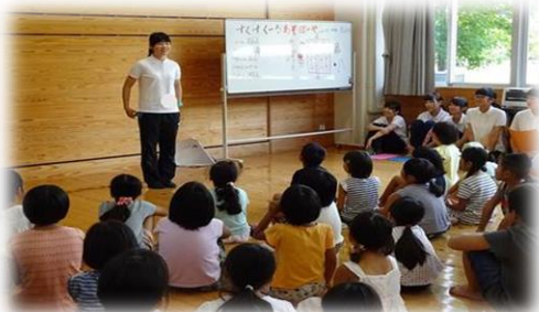
みんな、お姉さんのお話をしっかり聞いてくれたね。

山田高校の先生からは、「学生さんたちの子どもへの関わり方や運営進行は大変すばらしいと思い、私も勉強させていただきました。」という言葉をいただき、幼児教育コースの学生にとって幼小連携を学ぶよい機会となりました。