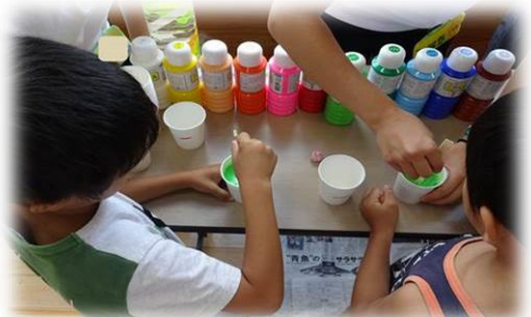
きれいな色のスーパーボールができそう!