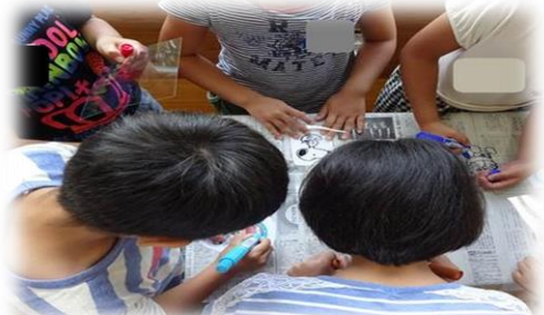
プラ板にうまく描けますように...