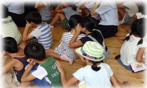
伝言ゲーム、うまく伝わるといいな。